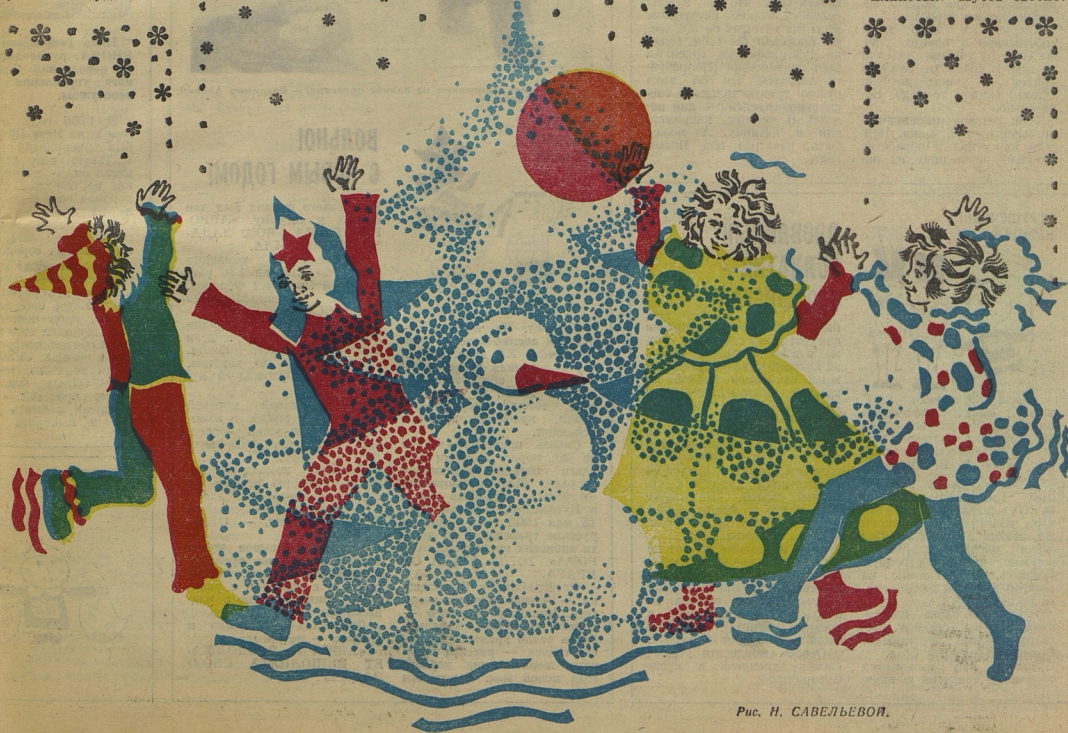
Рис. Н. САВЕЛЬЕВОЙ.

Вот бы взобраться по радуге на самую вершину и зажечь на ней ёлку для всех детей всей планеты! Пусть светит!